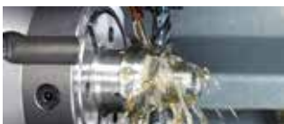
BP ジャパン(株) 金属加工用切削油