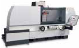
(株)岡本工作機械製作所 NC精密平面切削盤