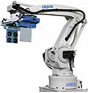
オークラ輸送機(株) パレタイジングロボット