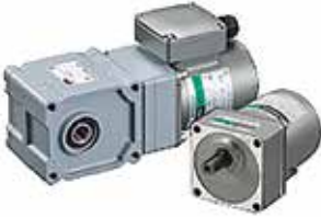
オリエンタルモーター(株) インダクションモーター