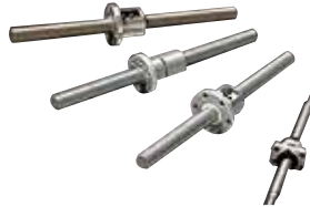
THK (株) ボールねじ