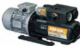
オリオン機械(株) ドライポンプ