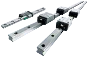
THK (株) LM ガイド