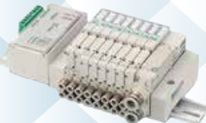
(株)コガネイ 空圧用電磁弁