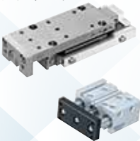
(株)コガネイ エアシリンダ