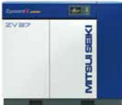
三井精機工業(株) スクリーコンプレッサ