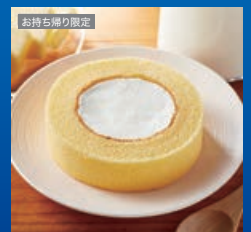
ウチカフェプレミアムロールケーキ

都合により商品が変更になる可能性があります。商品受け取り方法は裏面をご覧ください。スマートフォン以外の端末ではご利用いただけません。