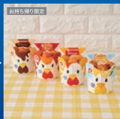
からあげクン 各種いずれか1つ