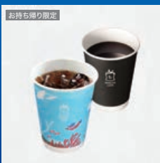
MACHI cafeドリンク(S) (1杯)