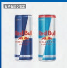
レッドブル 250ml 2種いずれか1つ