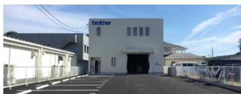
仙台営業所/ブラザーテクノロジーセンター仙台

〒984-0012 宮城県仙台市若林区六丁の目中町18番5号 TEL : 022-369-3981 FAX : 022-369-3982