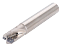
シャンクタイプ EVLX... 工具径: \phi 12 - 40 mm