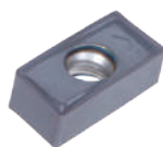
LXMU... APMX: 5 - 18 mm RE: 0.4, 0.8 mm