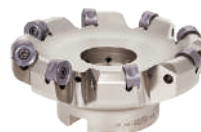
TASN13... 工具径: \phi 50 - 125 mm