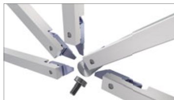
放射型刃物台対応